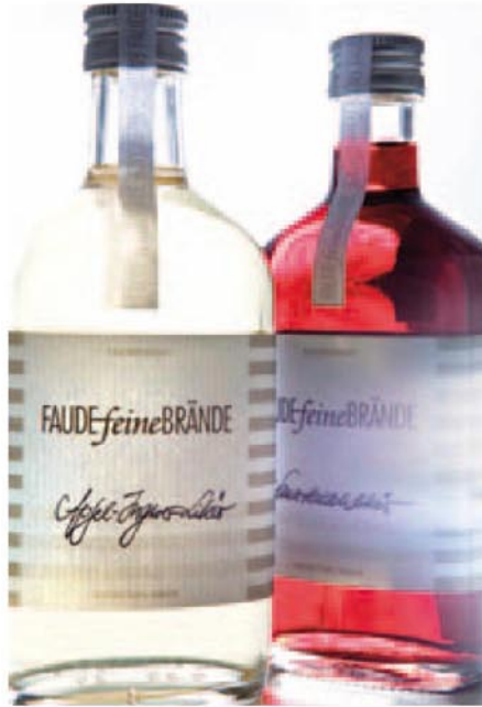
Schlichte Aufmachung: Brände in Apothekerflaschen und mit klarem Etikett.

Andere junge Menschen hätten angesichts einer solch positiven Entwicklung übrigens schon frühzeitig der Schule den